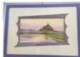
GAZEAU Marie-Françoise « Mort, Sarré Michel » aquarelle