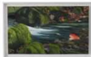
ROUSSEAU Odette « Et au milieu coule une rivière » huile