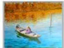
PELLETIER Jean-Claude « Vietnam » acrylique