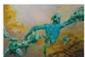
Sambuko « La marque du temps » acrylique sur PVC

Contact: 0680559531 l.art.en.village@gmail.com