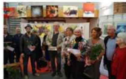
L'équipe de « L'art en village », les membres du jury, les gagnants

Les gagnants de l'expo peintures et sculptures 2016