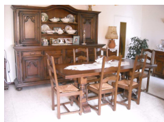
Table d'hôtes sur réservation: volailles maison, légumes du jardin, produits du terroir.

Etage: climatisation + chauffage central salon bibliothèque