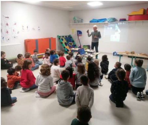
Petits mots doux

La visite a été une expérience qui a éveillé la curiosité, stimulé les sens. En offrant aux enfants la possibilité de découvrir leur patrimoine local, cette visite a semé les graines d'un intérêt durable pour l'histoire et la culture de leur commune. Les jeunes ont pris conscience du dévouement et de l'engagement nécessaires pour préserver le patrimoine local. Que ce soit à travers les histoires racontées ou les objets manipulés, cette expérience restera gravée dans la mémoire des jeunes comme un moment de découverte et de connexion avec leur passé.